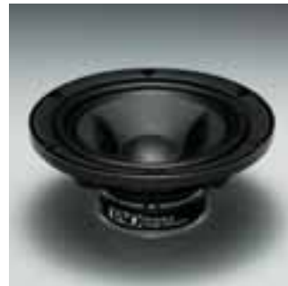
LFドライバーユニット

*1: Diffusion Effectual Convexity by Olson *2: Center Bobbin Coil *3: Dynamic Response Suspension