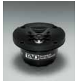
HFドライバーユニット